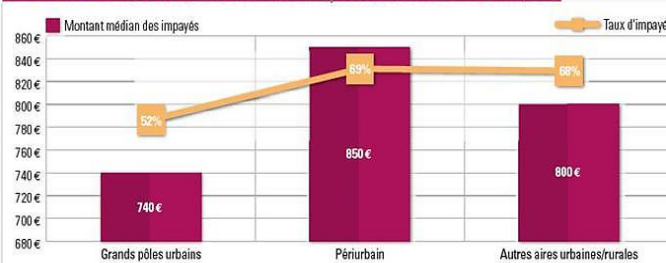
GRAPHIQUE 9. TAUX D'IMPAYÉS ET MONTANT MÉDIAN PAR ESPACE TERRITORIAL (2016)

Lecture : En 2016, les couples avec trois enfants ou plus ont un niveau de vie moyen annuel inférieur de 911 euros à celui des couples sans enfants.