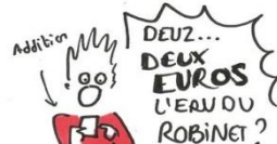
ILS RÂLENT PARCE QUE L'EAU EST PAYANTE