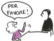
ILS DEMANDENT DU PAIN ET UNE CARAFE D'EAU AU RESTO