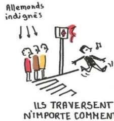
ILS TRAVERSENT N'IMPORTE COMMENT