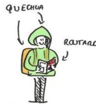
ILS ONT UNE PANOPLIE DU TOURISTE FRANÇAIS