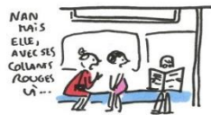
ILS CRITIQUENT LES GENS TOUT HAUT