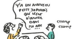
ILS PARLENT NOURRITURE MÊME À TABLE