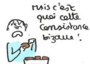
ILS RÂLENT PARCE QUE LE PAIN EST MAUVAIS