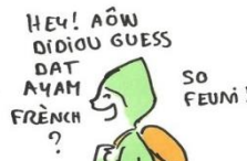
ILS PARLENT AVEC L'ACCENT